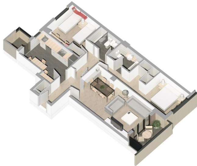
Ejemplo de vivienda ático de 2 dormitorios

Viviendas de dos y tres dormitorios, dos cuartos de baño, terraza, garaje y trastero distribuidas en seis plantas más planta ático. Precios con descuentos de hasta el 12,98% sobre el Precio Máximo Legal de Venta para "Vivienda con Protección Pública Básica".