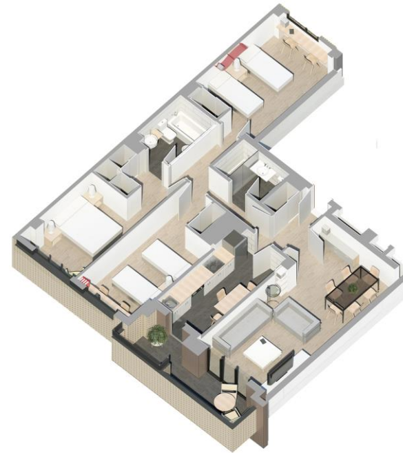
Ejemplo de vivienda de 3 dormitorios